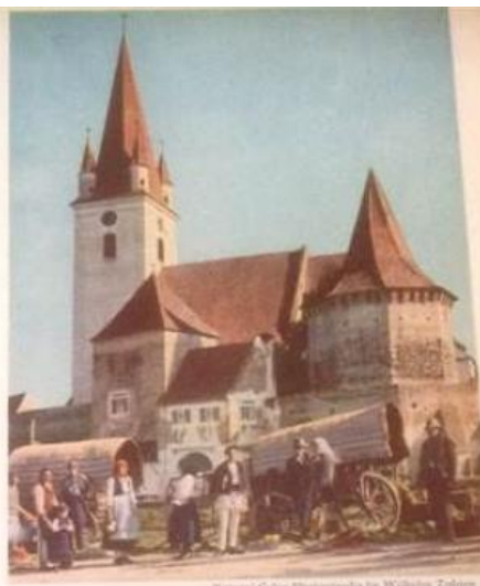
CHURCH AND FORT ARE MERGED IN ONE In the Sibiu district of Transylvania there are several villages with a definite Teutonic aspect. The houses are gabled, Hungarian and Swiss customs are seen, and three languages—German, Hungarian, Rumanian—are spoken.