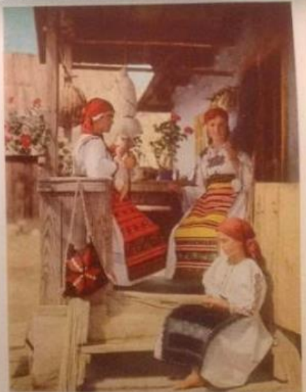
EVEN THE BLACK SHEEP HAS ITS DAY The girl at the upper right is transferring from shawl to specially named black wool for winter garments, such as the apron of her friend in the foreground. A Roman design, probably a heritage from early colonies, adorns the white undercoat of the spinner at the left.

“Odata ce am intrat in cateva orase din Transilvania, diferentele au devenit clare deoarece aceasta provincie, candva parte din Ungaria, a decis sa devina parte din Romania dupa razboi. Se pot vedea costume unguresti si saxone purtate de barbati inalti cu trasaturi maghiare. Deseori arhitectura este diferita de restul Romaniei, casele avand o alura germanica. Peste tot, semnele sunt in trei limbi – romana, germana si ungureste”.