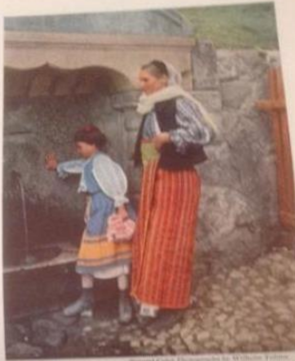
WASH DAY THE GIRL MAY WEAR HER BUSTLE SKIRT Such portions had a variety of uses. Frequently attached to the bottom of a skirt of blue or white woolen material, it was used to hold the laundry, which, suspended from the top of the basket, was carried to the wash.