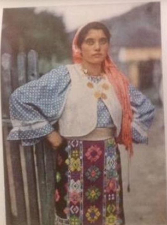
THIS DARK-EYED GIRL IS A GYPSY She wears the Romanian national costume in particularly gorgeous colors and lives at Kioke, for not all gypsies are nomads.