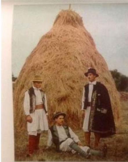
READY FOR A PEASANT'S SATURDAY NIGHT Two peasants of rural Transylvania, having finished their farm work for the day, don holiday attire. The one at the right wears an unusually fine black coat slung loosely across his shoulders, as is often the custom. Cockades of flowers add a touch of brightness.