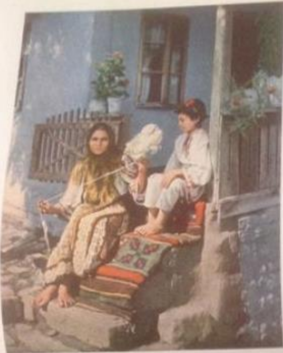
THE PEASANT WOMAN OF ROMANIA IS EVER SPINNING As a first step in the weaving of a rug, she draws and spins the wool from her distaff and winds it on her spindle. The spinning, done in the shade of the eaves and the shade of the wooden top of her bench.