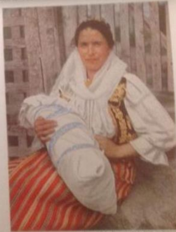
A BABY IN SWAZILAND EASTERN The mother claps to the baby that clings and bands of cloth, wound snugly around the infant, will keep his tiny limbs straight.

In calatoria lor spre Moldova , echipa National Geographic a nimerit intr-un catun "de patru-cinci case" unde se sarbatorea o nunta.