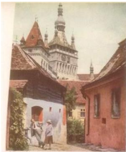
"THE TOWER OF THE HOUR" IS SIGHISOARA'S BIG BEN The towers and walls of the medieval city are as well preserved and distinctive as those of Carcassonne in France. Near this Transylvanian town one colonial architect of Berlin, Count John Smith, photographed the tower in 1872.